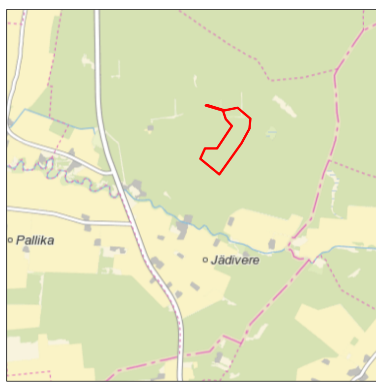
Kaardileht nr 6312 Järvakandi